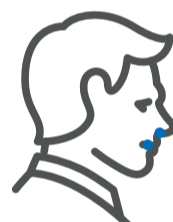
Pérdida del gusto u olfato