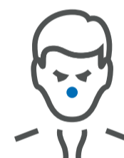
Rinitis / congestión nasal