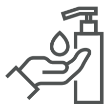
Mantener la higiene adecuada y frecuente de manos