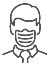
Uso adecuado del barbijo en espacios interiores, incluyendo los ámbitos laborales, educativos, sociales y el transporte público